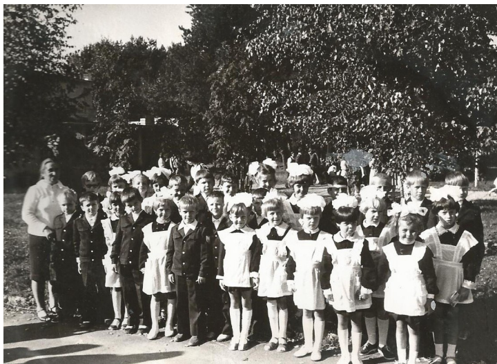
Первоклассники, 1986 год