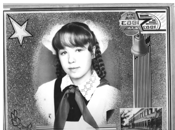
В школьные годы