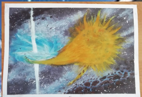
Рисунок Оганян К.