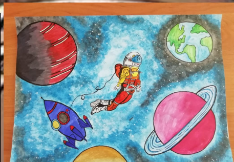
Рисунок Оганян К.